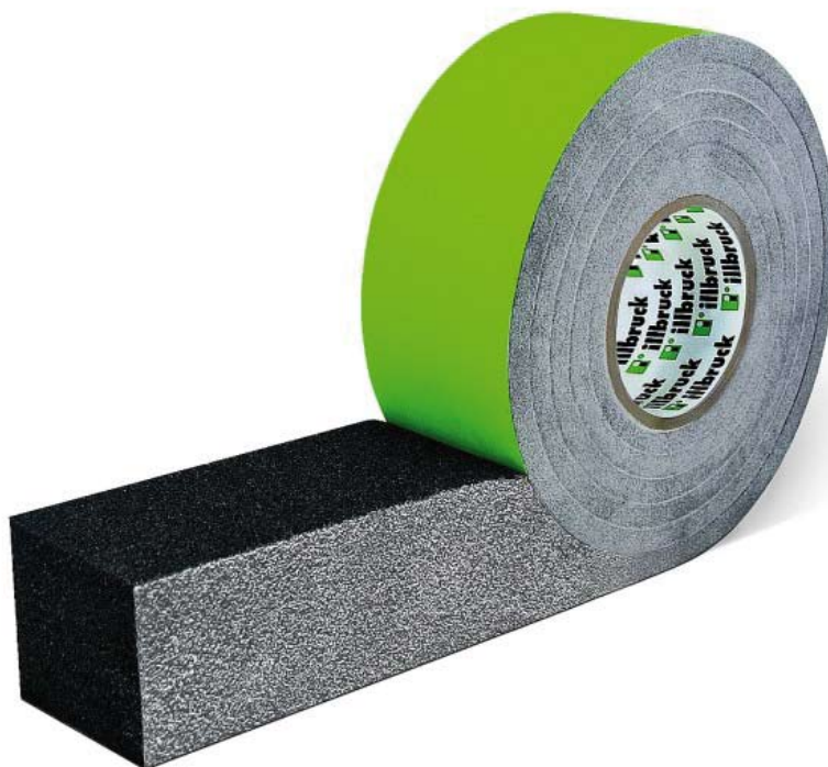
illbruck TP651 illmod Trio FBA